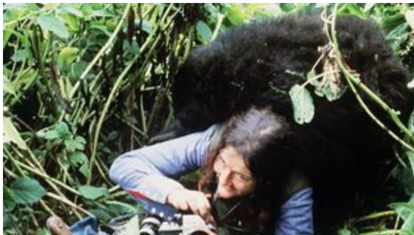
• Dian Fossey, une pionnière dans l'étude des gorilles