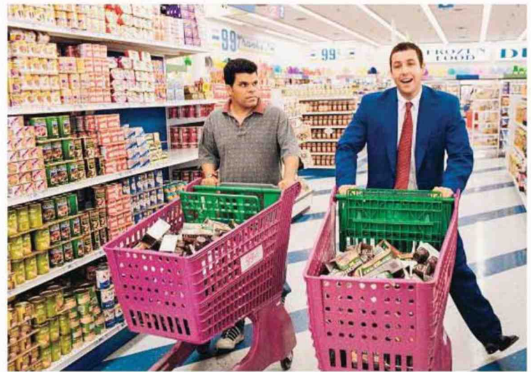
Dans « Punch-Drunk Love » (2002), Lance et Barry se ravitaillent entre copains.

Faire du sport à plusieurs. Comment trouver des partenaires de tennis, de badminton, ou des accros au yoga à côté de chez soi? Il suffit de s'inscrire sur l'application Need Sporty (sur iOS et Android, gratuite le premier mois, puis 1,79 euro par an), en indiquant son sport et son niveau, et de se retrouver pour transpirer au diapason!